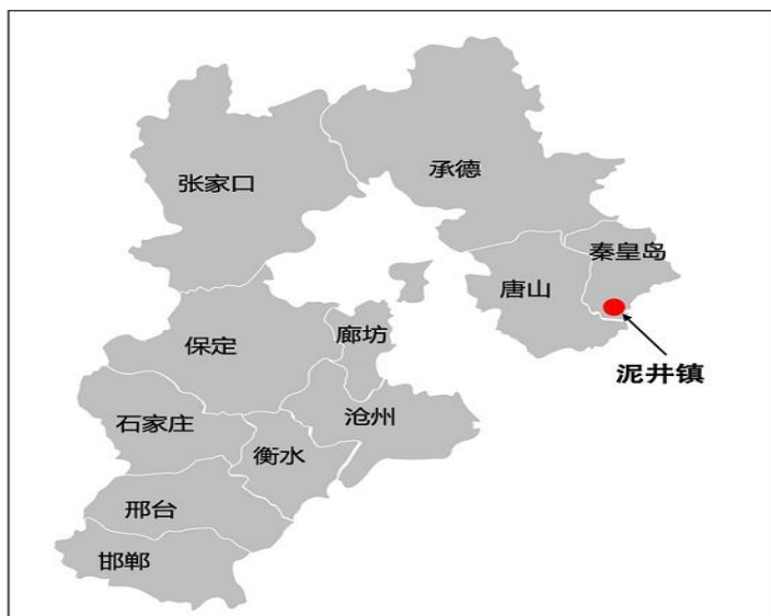
图 1 泥井镇地理位置示意图

井而庄村和新金铺一村、二村、三村（下文统称为新金铺三个村）位于冀东平原的泥井镇，村庄比邻而居。 ① 四个村庄都离泥井镇政府很近，交通便利，紧邻省道。